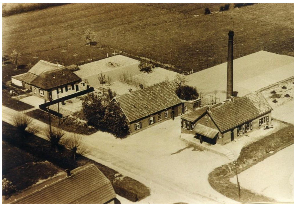
Luchtfoto pand Nederasselt